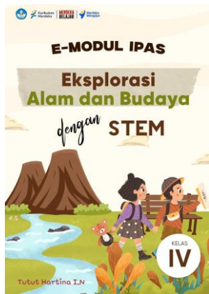
Gambar 2. Cover E-Modul IPAS

Semua e-modul yang telah dipublikasikan disertai dengan link yang memungkinkan pembaca dapat mengaksesnya secara online.